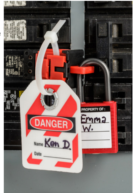
Beveiliging met kabelbinder en/of hangslot